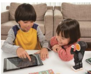
タブレット操作（イメージ）