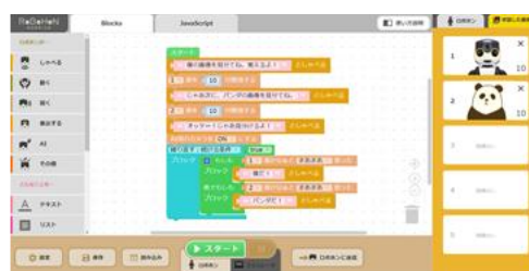
タブレット画面（イメージ）